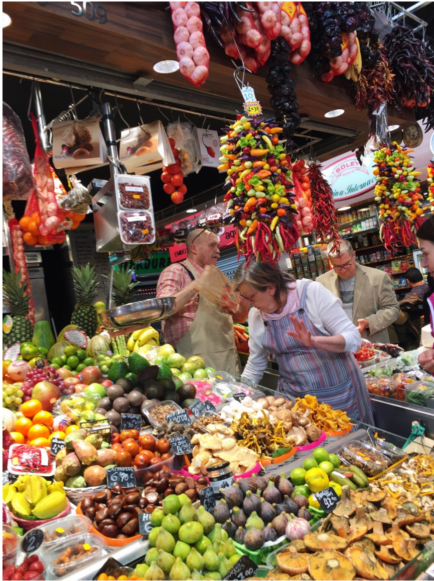
Frutas de la boqueria