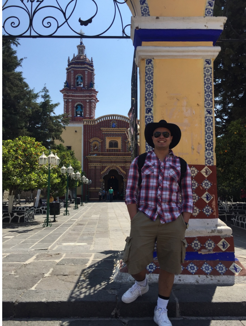
Esta foto fue tomada en mi viaje de inmersión en Puebla, Mexico con mi clase de sociología.